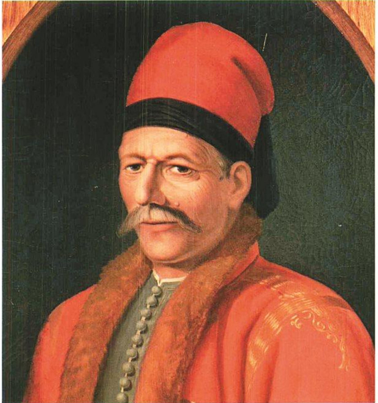
Ο Γ. Λογοθέτης Λυκούργος (1772 - 1850)