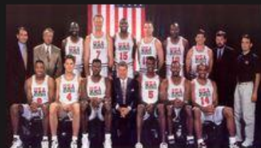
Dream Team (ΗΠΑ)

Χώρα: Ηνωμένες Πολιτείες Αμερικής Αθλημα: Μπάσκετ Ολυμπιακά Μετάλλια: 1 χρυσό